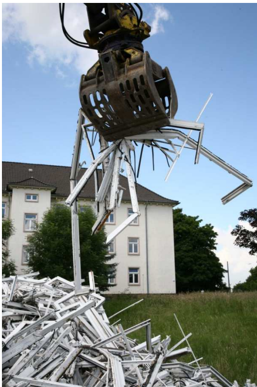
PVC-Fenster auf der Baustelle

Aus PVC-Fenstern, die beim Rückbau von Gebäuden anfallen, können wieder neue PVC-Fensterprofile hergestellt (werkstoffliches Recycling) werden. Auch die Sammlung und Rückführung von einzelnen oder wenigen Fenstern ins Recycling ist sinnvoll.