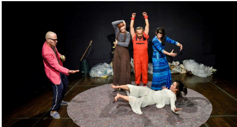
Theater GAIA «Der lebende Planet» 36 Vorführungen / 180 Schulklassen