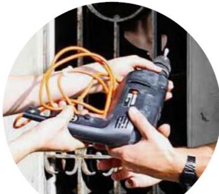
Teilen statt kaufen www.pumpipumpe.ch