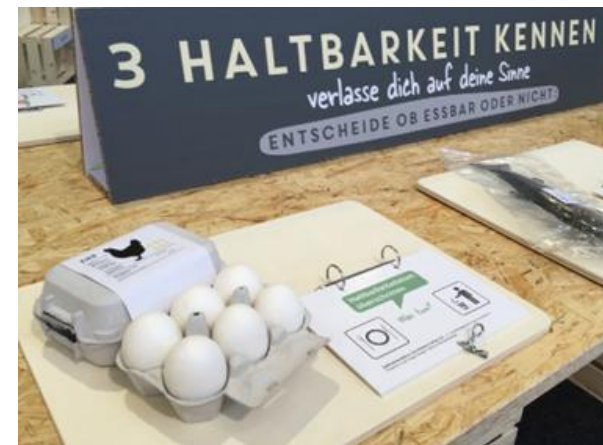
Ausstellung «Food Waste» 19 Einsätze

Weiterführung der bestehenden Kampagnen-Angebote: Reparaturführer, Repair Cafés, Bücherschränke, Naschgärten, Pumpipumpe Stickershops, Kampagnen-Webseite.