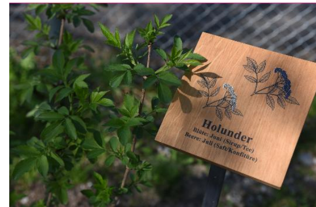
Wann die Beeren und Früchte reif sind und wie sie dann aussehen, zeigt die Beschilderung.