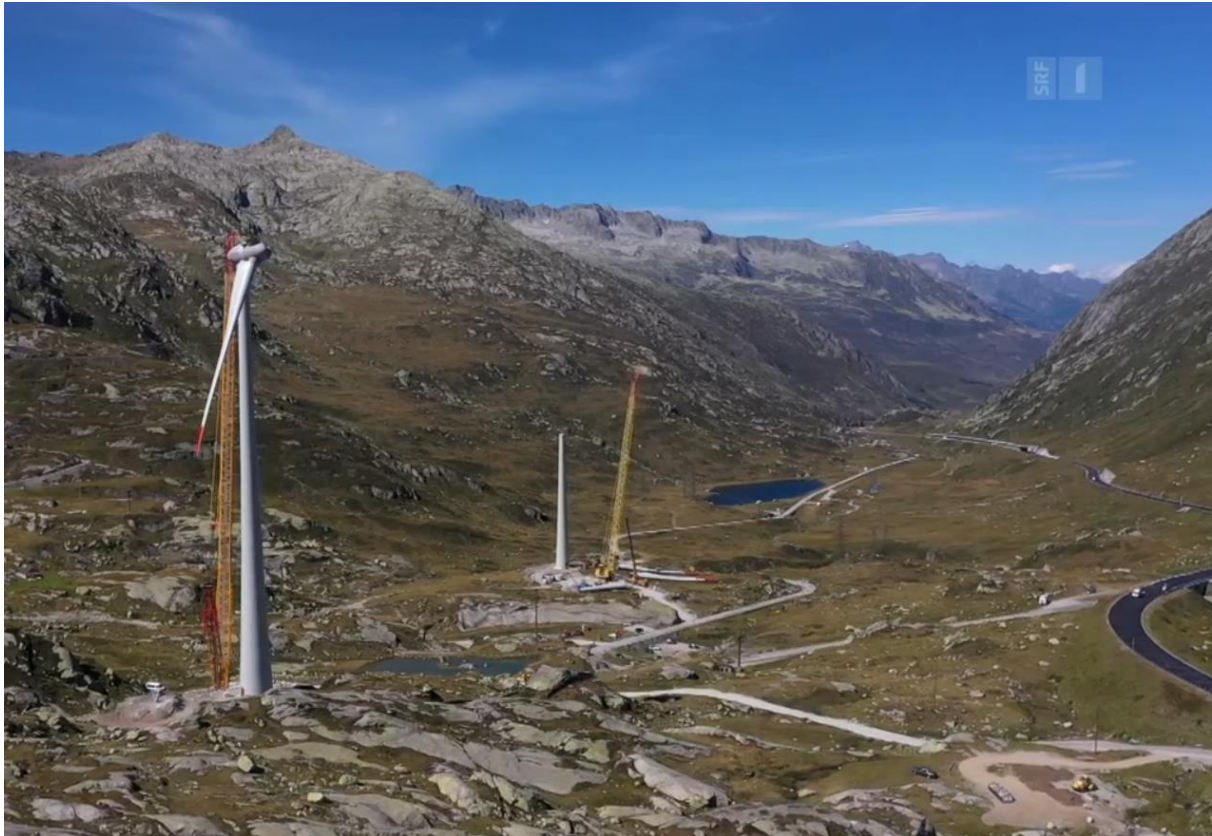
Baustelle des Windparks Gotthard, September 2020.