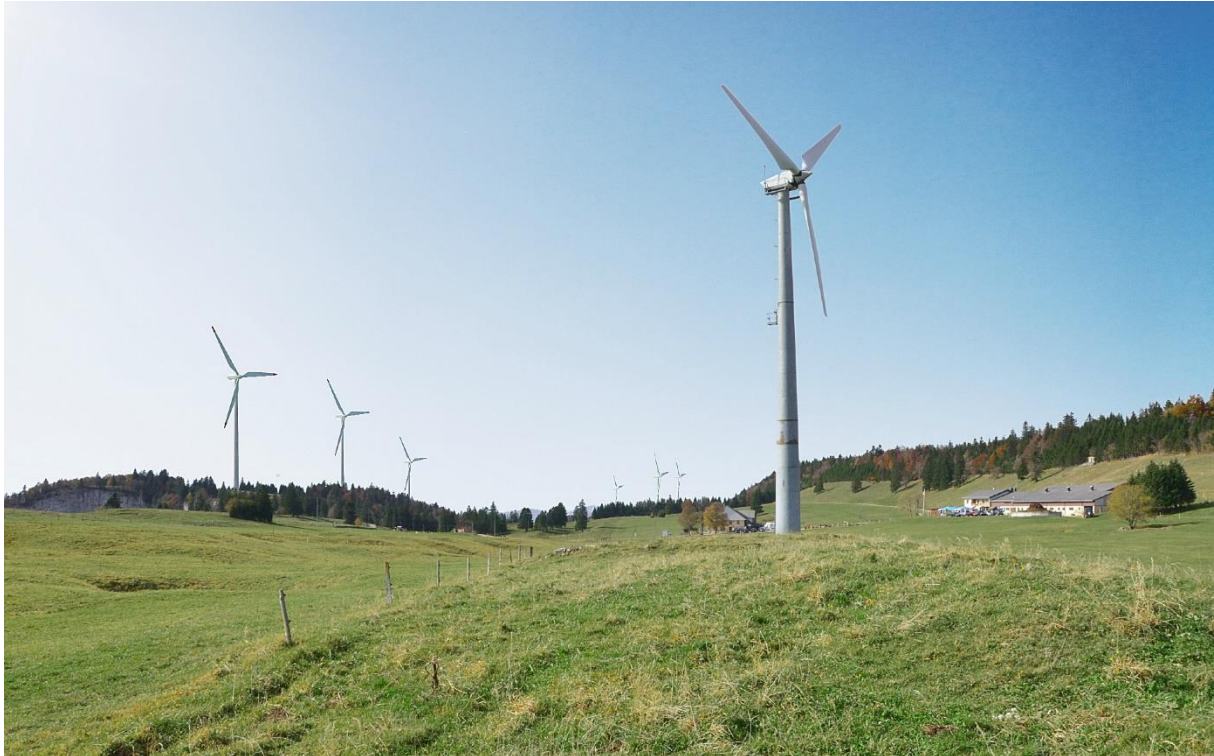
Visualisierung Windenergieanlage Grenchenberg